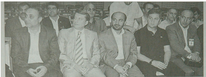
Iran'ın Hemedan eyaletinden Bursa'ya gelen 32 iş adamı, Ticaret ve Sanayi Odası'nda (BTSO) Türk iş adamlarıyla bir araya gelip ikili görüşmelerde bulundular.