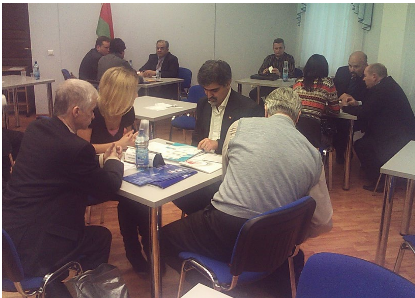
جلسه کارگروه‌های تخصصی در اتاق بازرگانی بلاروس