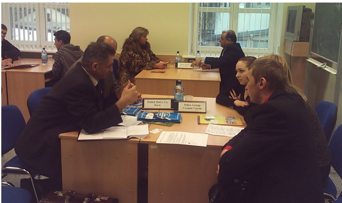
جلسه کارگروه‌های تخصصی در اتاق بازرگانی بلاروس