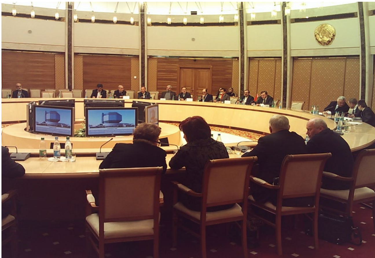
همایش فرصت‌های سرمایه‌گذاری ایران و بلاروس