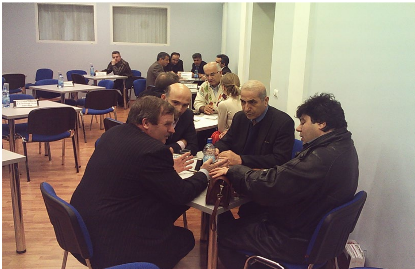
جلسه کارگروه‌های تخصصی در اتاق بازرگانی بلاروس