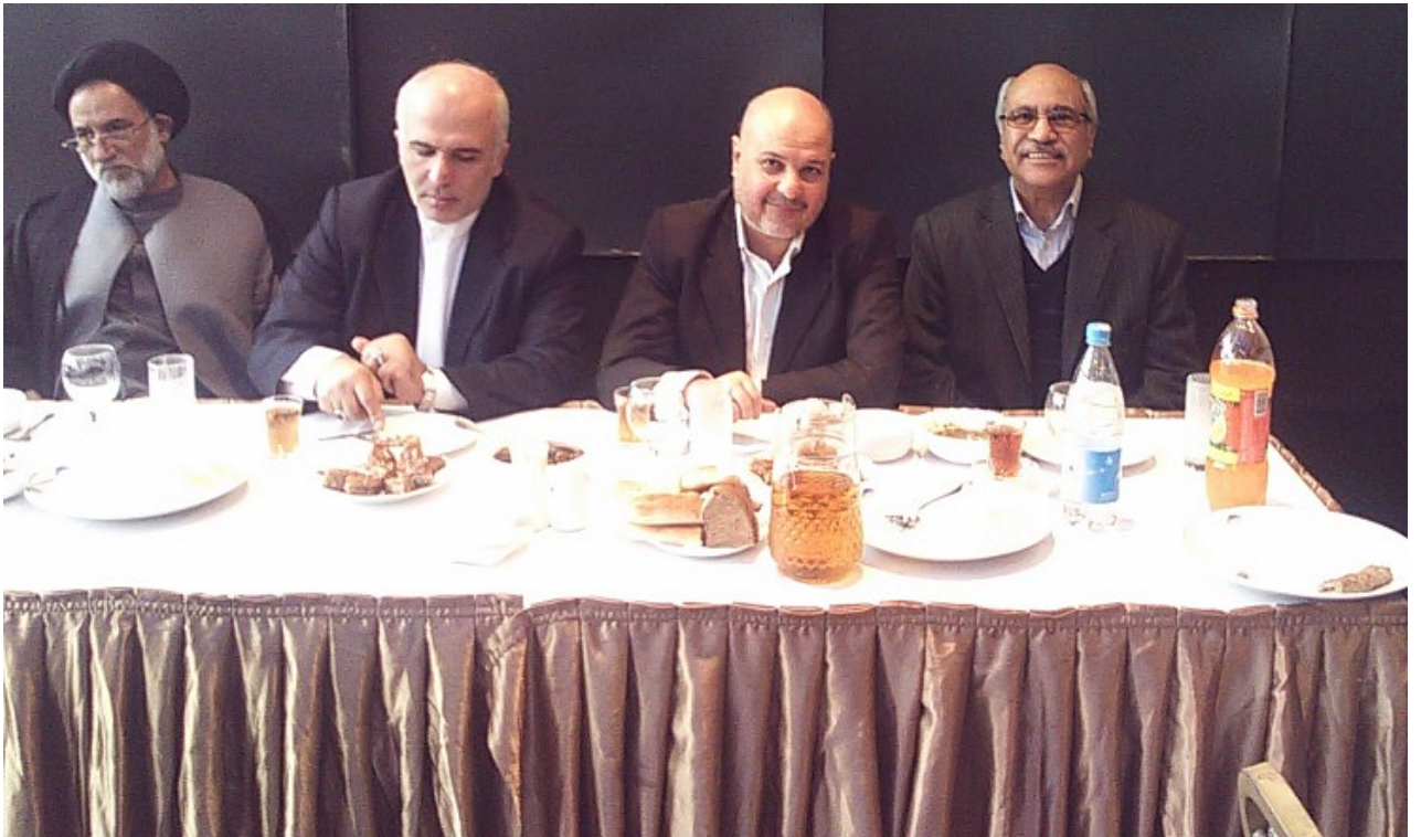
حضور وزیر بازرگانی محترم و سفیر ج.ا.ا در ضیافت شام در کنار اعضاء هیئت