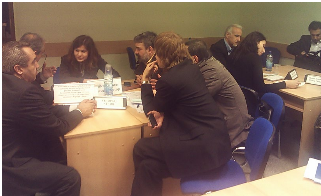
جلسه کارگروه‌های تخصصی در اتاق بازرگانی بلاروس