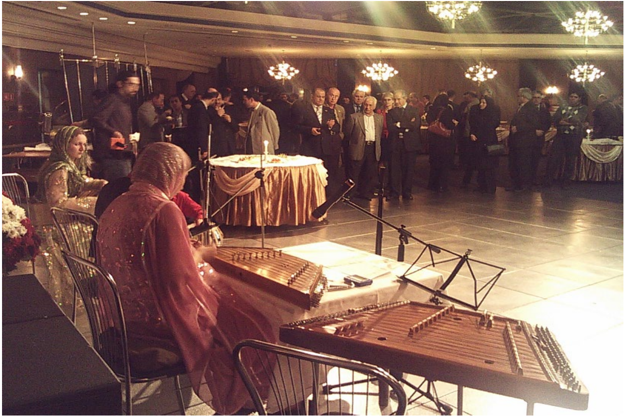
جشن پیروزی انقلاب و ضیافت شام در ستوران ژورایونگا با حضور هیات ایرانی و مدعوینی که از طرف سفارت ج.ا.ا دعوت گردیدند.